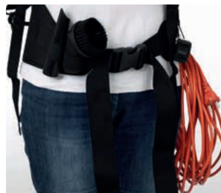
Les accessoires se rangent sur la ceinture pour un accès aisé