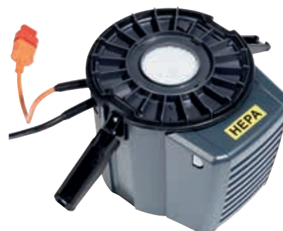
Filtre d'échappement HEPA en série simple d'installation