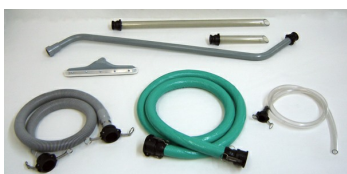
ARU STD Tools and Accessories - Included