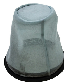
Liquid Filter - Included