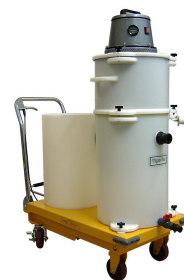
2D-ARU-15 STD (HY-C) MRAC