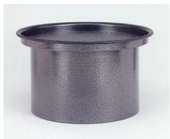
Activated Carbon Cartridge - Optional