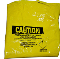
Asbestos Polyliner (6) W retaining clip (not shown) - Included