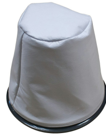
Main Cloth Filter - Included