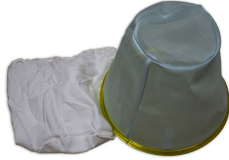
Dralon Pre-Filter & Liquid Filter - Included