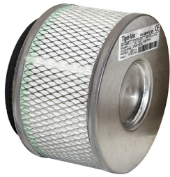
HEPA Filter - Included