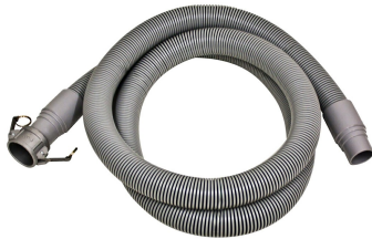
PVC Crushproof Suction Hose Assembly - Included