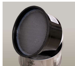
Activated Carbon Cartridge for Mercury Recovery - Included