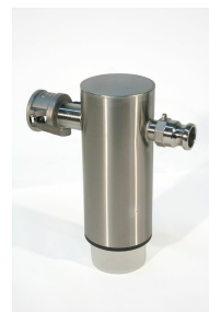
Mercury Recovery Separator with Jar - Included