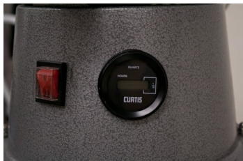
Hour Counter for MRV models - Included