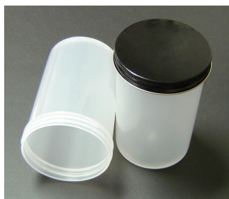
Jar for Mercury Recovery, 20 oz (540 ml) with lid - Optional