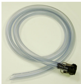
Clear Suction Hose Assembly for use with Mercury Separator - Included