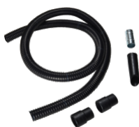
P12374 ATEX STARTER KIT Ø 40MM Kit complet d'accessoires spécifiques pour l'application d'aspiration d'huile et de copeaux de 40 mm de diamètre