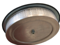
HEPA 14 Filtre absolu (EN 1822-5)