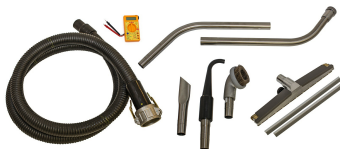
Ø1.5 (Ø38 mm) Static Dissipative Tools and Accessories - Included