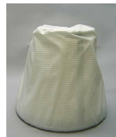
Pre-Filter, Static Dissipative - Included