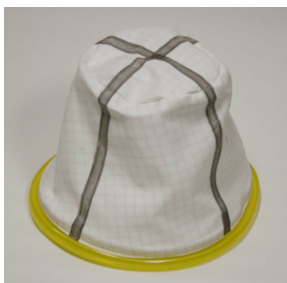
Main Cloth Filter, Static Dissipative - Included