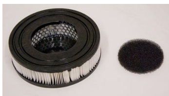
Micro Filter for model T1-3L NO HEPA - Included