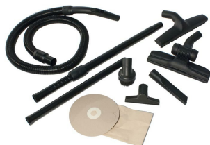
T1-3L Complete Toolkit - Included (optional tools also shown)