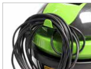
CROCHET POUR CÂBLE