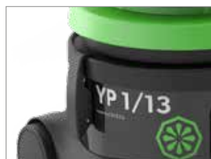
ATTACHES FLEXIBLES ET RÉSISTANTES