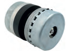
Moteur sans charbon brushless