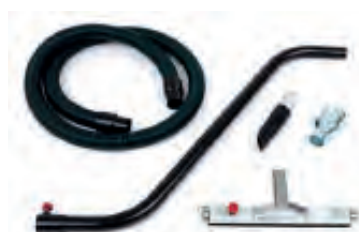
Kit antistatique D40mm inclus