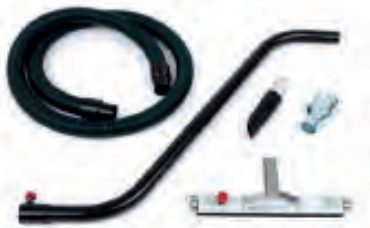
Kit antistatique D40mm inclus