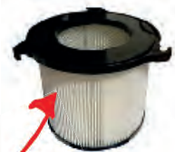
Cartouche de filtration de sécurité