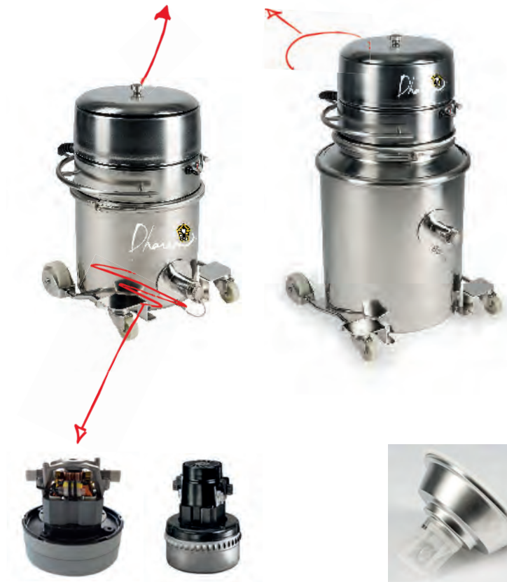
Moteur monophasé 230 V