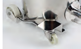
Roues industrielles protégées