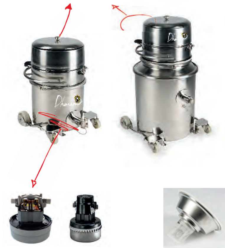
Moteur monophasé 230 V