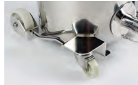
Roues industrielles protégées