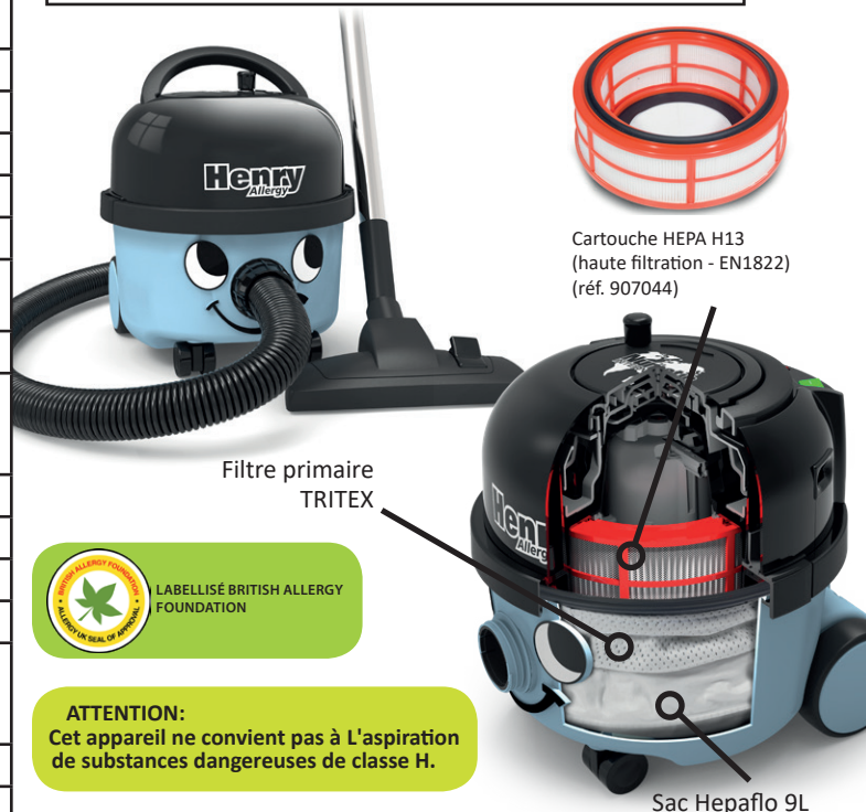
Cartouche HEPA H13 (haute filtration - EN1822) (réf. 907044)