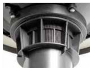
SYSTÈME ANTI-MOUSSE INTÉGRÉ