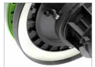
JOINT DE TÊTE NOVATEUR