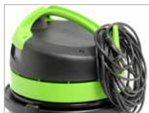
CROCHET POUR CÂBLE