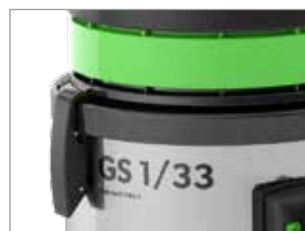
JOINT DE TÊTE NOVATEUR