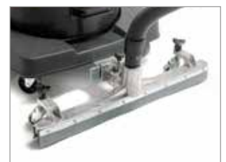
SUCEUR FIXE EN OPTION