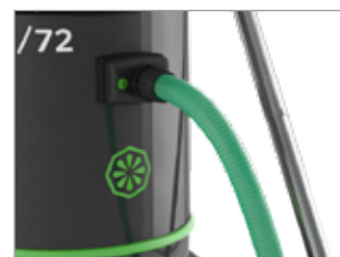
LE FLEXIBLE EST BLOQUÉ DE MANIÈRE SÛRE ET FIABLE