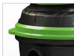
PROTECTION LATÉRALE CONTRE LES PORTES ET LES MURS