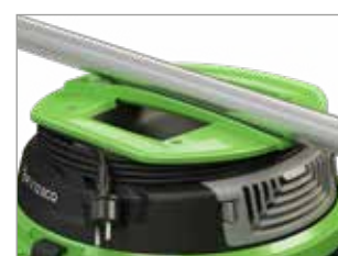
POIGNÉE ERGONOMIQUE AVEC ENROULEUR DE CÂBLE INTÉGRÉ